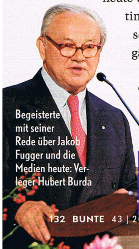
Begeisterte mit seiner Rede über Jakob Fugger und die Medien heute: Verleger Hubert Burda