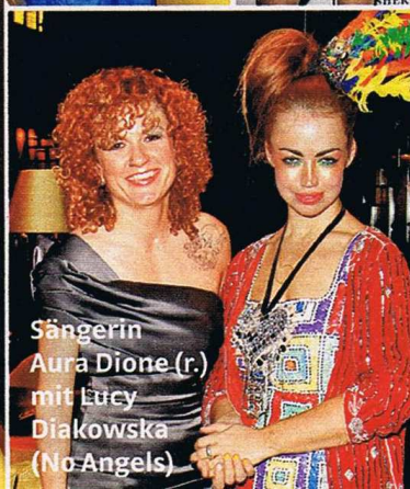
Sängerin Aura Dione (r.) mit Lucy Diakowska (No Angels)